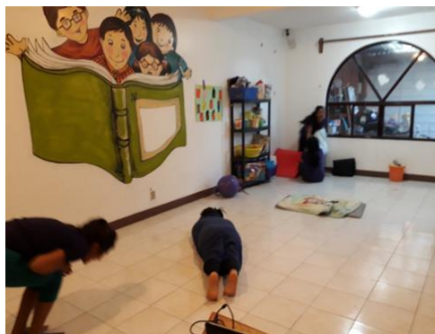
Ilustración 1.- Dinámica de Instrucciones

Se realizaron diversas estrategias para hacer conciencia del objetivo del taller. Cada sesión finalizo con una retroalimentación sobre todo lo vivido y con preguntas de la intervención psicoterapéutica Gestalt que son: ¿Qué te llevas de la sesión?, ¿Cómo te vas? ¿De qué te das cuenta? A las cuales cada una de las participantes comenta sobre ellas.