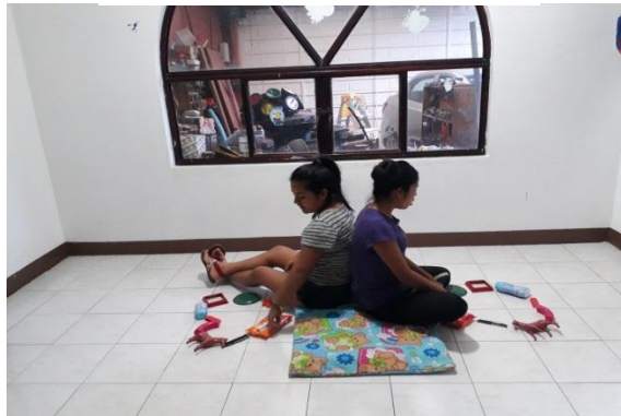
Ilustración 4.- Comunicación

En dicha dinámica se manifestaron diversas emociones como molestia, incomodidad, inconformidad al no lograr el resultado deseado. Cabe mencionar que para un equipo fue casi instantáneo el logro, hecho que apoyo a la introducción del tema siguiente sobre empatía. Se rescataron los puntos que favorecieron el buen funcionamiento y se comentaron las limitantes de la comunicación.