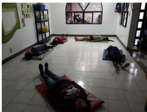
Ilustración 11.- Autoestima

Se realizó un ejercicio de Amor hacia sí mismo, hacia su entorno familiar y por último laboral, se hizo hincapié en la labor tan importante que desempeñan ellas como agentes educativo.