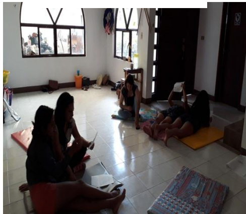
Ilustración 5.- Dramatización

En dicha dinámica se manifestaron diversas emociones como molestia, incomodidad, inconformidad al no lograr el resultado deseado. Cabe mencionar que para un equipo fue casi instantáneo el logro, hecho que apoyo a la introducción del tema siguiente sobre empatía. Se rescataron los puntos que favorecieron el buen funcionamiento y se comentaron las limitantes de la comunicación.