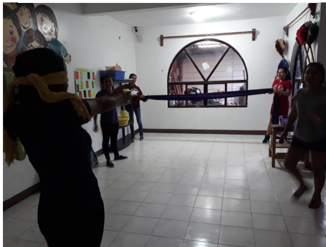
Ilustración 3.- Dinámica de "Los miedos que me limitan"

Se realizó un ejercicio de comunicación, en parejas sentadas en el piso y de espaldas, se les informa que se les darán una serie de objeto, que una de ellas va a realizar una figura, la que guste y como guste, después le comunicará a su compañera la instrucción para que al finalizar ambas tengan la misma figura. Se les indica que por ningún motivo