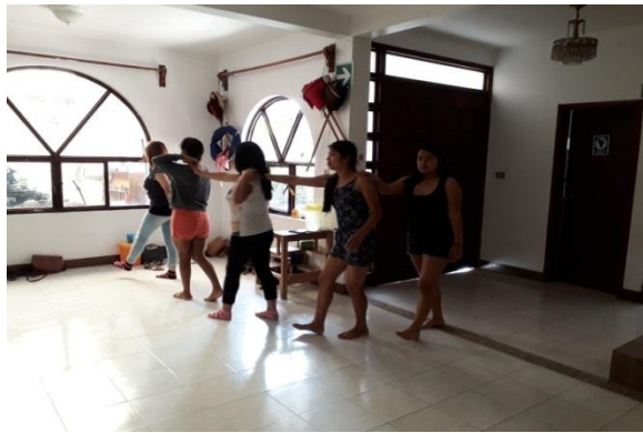
Ilustración 10.- Autoconfianza en la comunicación

Se enfatizó en la responsabilidad de las percepciones que cada una genera de “algo que se dice” y lo que realmente el otro nos están diciendo.