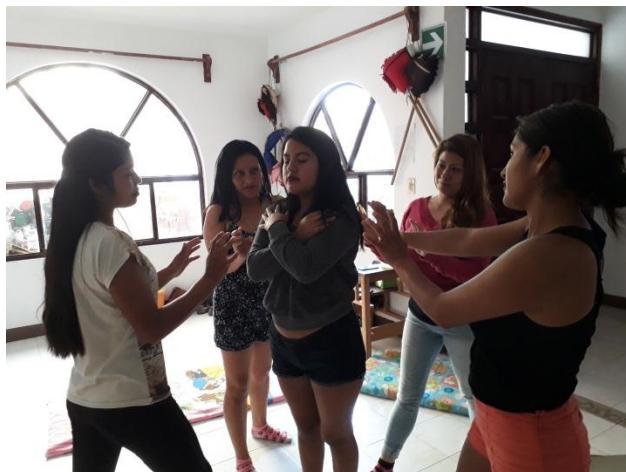
Ilustración 2.- Péndulo de confianza

Se realizaron diversas estrategias para hacer conciencia del objetivo del taller. Cada sesión finalizo con una retroalimentación sobre todo lo vivido y con preguntas de la intervención psicoterapéutica Gestalt que son: ¿Qué te llevas de la sesión?, ¿Cómo te vas? ¿De qué te das cuenta? A las cuales cada una de las participantes comenta sobre ellas.